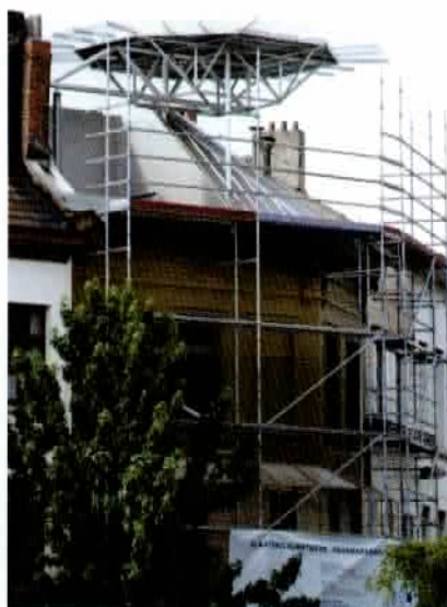
Het helikopterplatform was voor de kunstenaar de kers op de taart van het totale renovatieproject.